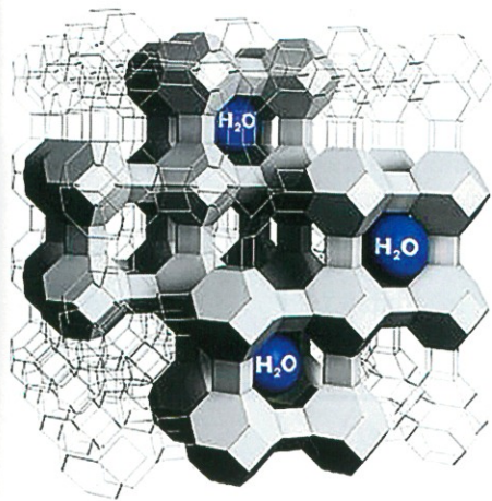
Рис. 2. Упрощенная цеолитовая структура

равный 4 Å [18]. Размер молекул воды (3–4 Å) — близкий к размеру пор цеолита NaA, что обеспечивает ее глубокое избирательное удаление из трансформаторного масла даже при низком содержании, а полярность цеолитов обеспечивает высокую скорость процесса.